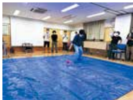
疑似嘔吐物を落とす

特に感染性胃腸炎の発生時には、嘔吐物処理の演習において、模擬吐物に蛍光剤を混ぜることで飛散範囲を可視化し、環境整備の重要性を改めて実感する機会となりました。講師からは、今シーズンに向けた具体的な感染対策についてもご指導をいただいております。 (医療 平沢世子)