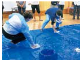
嘔吐物処理の演習