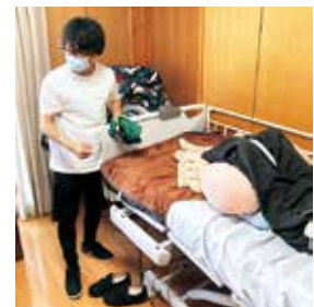
圧迫する力を分散させる ポジショニング