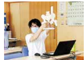
褥瘡の原因となる骨を学ぶ