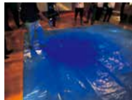
可視化された飛散範囲 (光っている範囲)