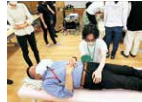
圧迫される力を体験する

かりがね福祉会に褥瘡対策委員会というものがあることはご存知でしょうか？ また、「褥瘡」という言葉があることもご存知でしょうか？ 褥瘡とは、いわゆる「床ずれ」のことです。昨年度より地味にコツコツと活動をさせていただいており、本年度から医療衛生委員会の中で少しずつではありますが、活動の内容をお伝えしています。高齢社会は世間だけではなく、もちろん法人内でも進んでおり、生活支援から介護に移行し、今後も増加していくことと思います。身体活動が低下した方に起きるリスクは様々ですが、褥瘡もその一つであり、日頃からの皆さんの介護によって予防が可能なものです。自分で動けない方に対してどこを観察し、どんな注意が必要になるのか、日頃から関わりの多い支援員さんの協力が大きな力になります。例えば、自分で身体を動かすことが難しい方がいた時に、今の姿勢はどう感じるか、長時間同じ姿勢だったらどう感じるか、自分だったらどうしてほしいか、また、自分の大切な人だったらどうしてあげたいか。常に介護を必要とする方と同じ目線になって考えて、行動することを大切にいただければ自然に良い介護ができるようになると思います。 (医療 小林智恵美)